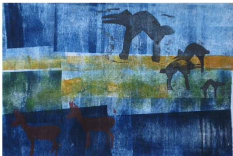
Hjorten ved skovsøen 1

Fyrets café er åben den 20. og 21. samt den 27. og 28. februar kl. 13:00 – 16:00.