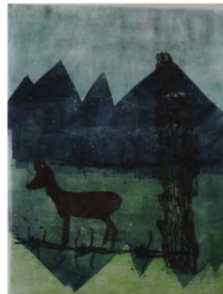
Hjorten ved skovsøen 3